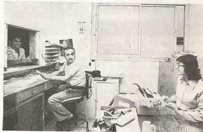
הקופה בעבודתה היומית.

סתם יום של חול במחלקת החשבונות של החברה, ב, משרד האוצר הקטן, המחשב והמקוץ, הנותן והמנכה. סך כל פעולותיו המשובכות והמפותלות, הקשורות במאות פריטים של זכאות וחייבות מתמצות בסומו של דבר בתלוש המשכורת ולגבי הימאי השורה האחרונה היא הקובעת. אותה שורה סופית ובה טור ספרות קצר, המבטא בלשון מתמטית את סך כל עבודתו, מאמציו ו... תקוותיו לשכר נטו גבוה יותר.