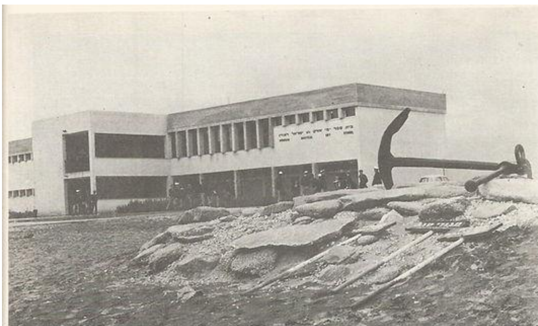
מראה כללי של בית הספר התיכון הימי אורט באשדוד