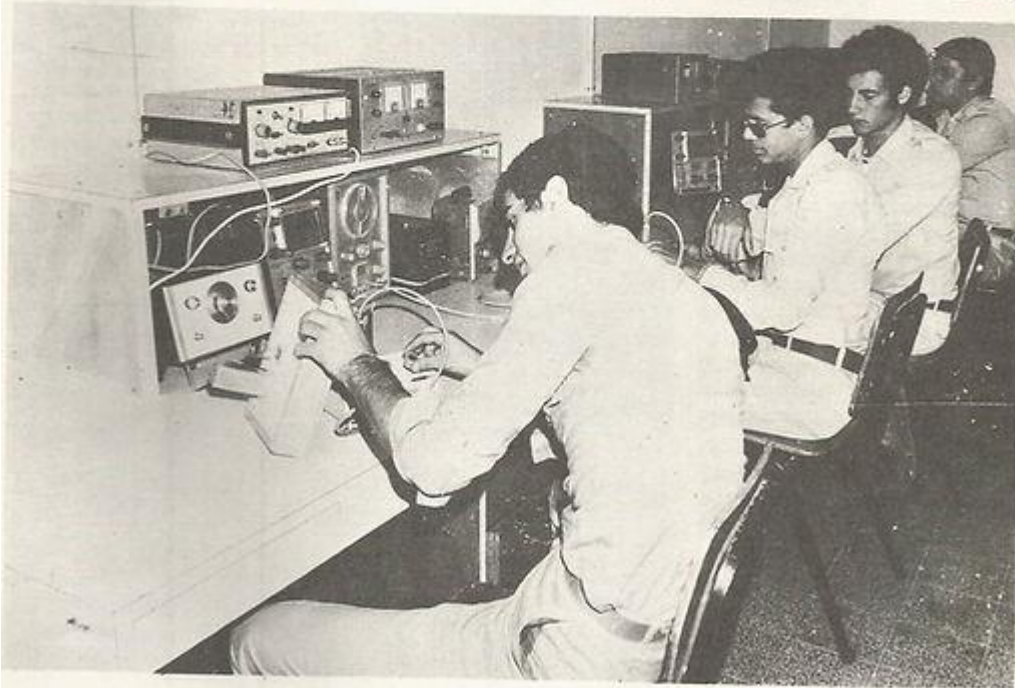
במעבדת האלוטש במגמת רדיו — עושים תלמידי כיתה י"ב בבית הספר התיכון הימי אורט באשדוד.