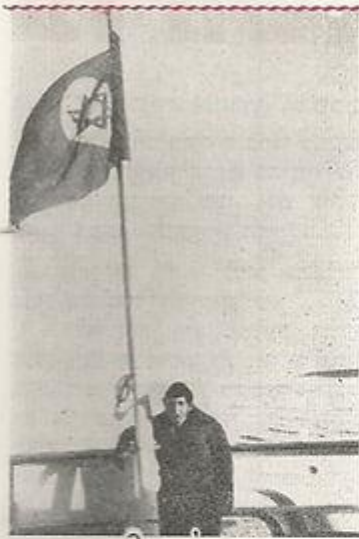
א/מ, "תל-אביב" נאבקת בקרח בסט. לורנס קנדה

שעגנו בפורט-קרטיר הגיע שם הקור ל- יותר מ-30 מעלות מתחת לאפס החברה סבלו מהקור הזה כהוגן. כשיצאנו מפורט-קרטיר היה היום מכוסה בקרח והרגשנו עצמנו כמו על שוברת קרח. עד פורט קרטיר עבדנו בעיקר על ניקוי האניה. כשיצאנו מגיראורליאנס לכיוון חיפה היא כבר היתה נקייה, פחות או יותר, והת-חילה לקבל פרוצוף של אניה שאפשר להסתכל עליה. כטוב, עדיין יש עוד הר-בה מה לעשות ולשפר בה.