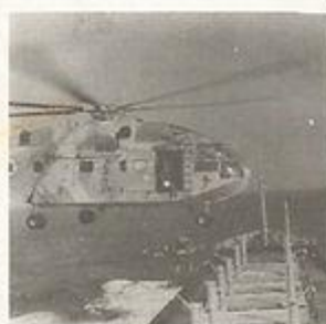
4. המצוץ מועלה למסוק.