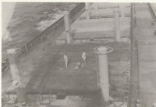
1. המצוץ שוכב באלונקה מוכן לפינוי והחובל הואשון קרן ניל זרב המלחים סלמה אדוארד ממתחים.

ביום 30.6.78 נמנע מלה כשיר בילו יום טוב לא רחוק מחופי הארץ. מסוק של חיל האוויר נזקק למנוחה לכית החולים.