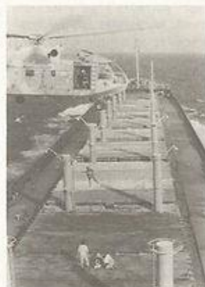
2. איש מצוות המסוק מורד לקשור את האלונקה.