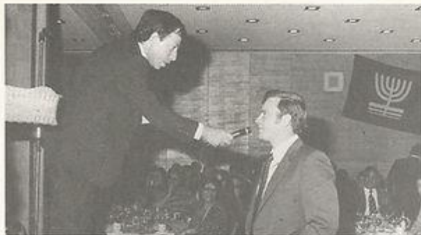
מיר לסקוביץ מגריל ברטים טיסה כמול לרומא וחזרה.