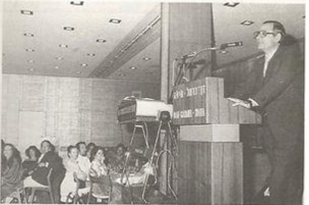
מר י. ריקנאטי משבח את 25 השנים הראשונות.