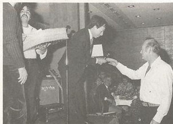
רנח רנאל מגריל ברטים טיסה כמול לסנטה קטרינה וחזרה.