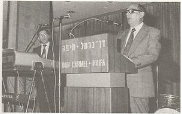
מר כללים מברך בשם עובדי החוף.

המונסון הקיצי הגורם לרוחות דרוי מיות-מערביות באיקאנוס ההודי ובים הערבי, מביא להופעה נוספת: סמפרטוי רת מי הים בקרבת חופי האי ערב מינומלית בקיץ למרות החום הרב. תופעה זו נגרמת עקב פעולת הרוחות הדרום מערביות המסיעות את מי הים בשכבה העליונה לכיוון צפון מזרח ומי רת, ולכן עולים מי הים הקרים ממעמ' קים למלא את החסר, בכך נוטלת טמפ' רטורת מי הים. קרוב לפני השטח.