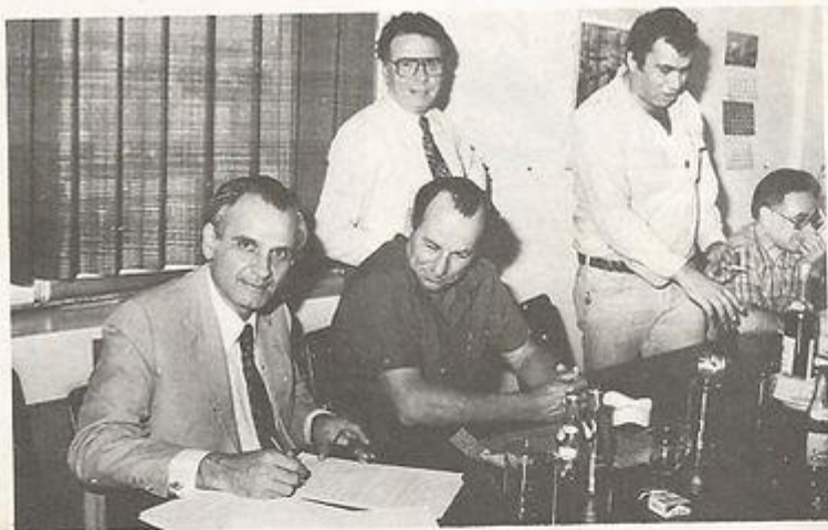
"גמר חתימה טובה"

התאפשר תשלום השכר החדש כבר מחודש אפריל. מי שאזכר את הבער יות שהיו כרוכות בשנים קודמות בהפעלת השכר החדש, את ההתחשבנויות הסבוכות, את הפיגורים והתשלומים הריטוראקטיביים, ידע לקבל בהערכה את התלוש החדש, המציין בתחמו עידן חדש.