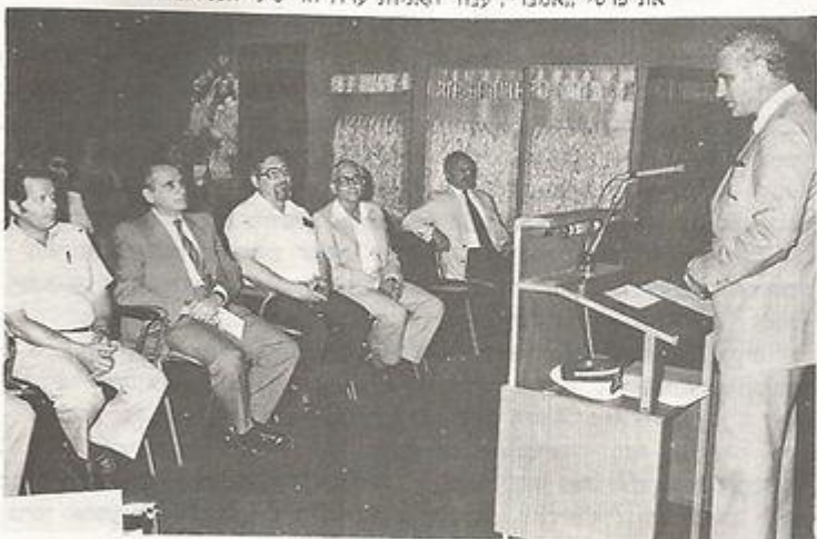
מר גולדשמיט מברך את מקבלי הפרסים