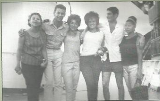
המנה משפחתית עם נשות הים אמריקניות במסעם קפואים-סרד, בלימה-סרד.

התחדשה עוד עד שתוקן בנמל לימה. המעבר במיצרי מגלאן בשלהי הקיץ הדרומי היה חוויה בלתי נשכחת: השמש שוקעת ב-11 בלילה וזורחת בשתיים לפנות בוקר. נופי בראשית ללא נפש חייה, דרומית לעיר פונטה ארנאס, אך אלפי אריות-ים וציפורי קוטב נראים על החופים הסובבים אותנו ועל השוניות הרבות. קרחונים כחולים גולשים לתוך הפיורדים ואת האונייה מלווה דרך קבע להקת אלבטרוסים, אשר מוטת כנפיהם מעל לשני מטרים. אלו מרחפים דרך קבע מאחורי הגלעד וממתנים למנת הזבל היומית. בעת ההיא עוד מקובל היה להשליך לים כל פסולת. הנמלים היו מיוחדים ועל אף שימי השבת (lay days) של הגלעד היו מעטים וקצרים, ניתן היה לטייל ולסייר. היינו צוות טיולים מאורגן