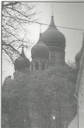
קתדרלה אחת מני רבות

הולדתו וילנא בליטא. המפגש המחודש עם קרובי משפחתו, שבחלקם היו בשלבי התארגנות לעלייה לארץ, היה מאוד מרגש ולא פעם אחת שמענו אותו חוזר ואומר: "זה הדבר האחרון שיכולתי להאמין, שאראה שוב את מקום הולדתי." לסיכום, אני מבקש לחזור ולהדגיש, שלדעתי זה מקום שאסור להחמיצו. לכל מי שמפליג לאזור אני ממליץ בחום לבקר שם ולעבור חוויות מרגשות במיוחד מעבר למסך הברזל.