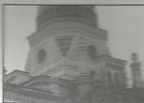
בית הכנסת המפואר בלנינגרד