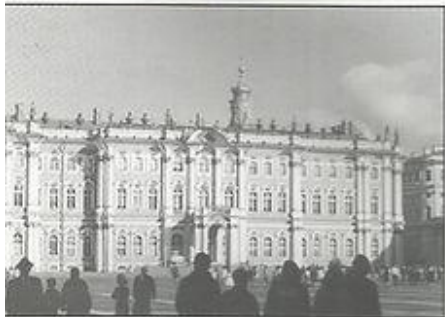
ברחבה של ארמון החורף בלנינגרד