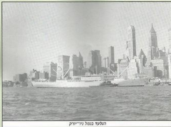
הגלעד בנמל ניו-יורק