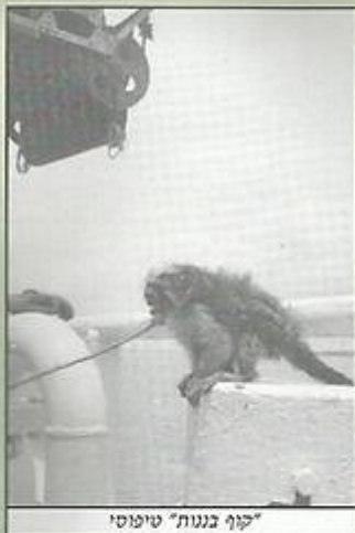
"קוף בגנות" שיטטי

צוות הסיפון והמכונה (הדירוגים) באוניות הבנות, הרכב ברובו מאקוודוריאנים. היו בלון ואורטנה והיה ח'אראמיז והיה חוליו המגיש בחדר אוכל קצינים. אחדים מהם המשיכו להפליג באוניות אליים שנים