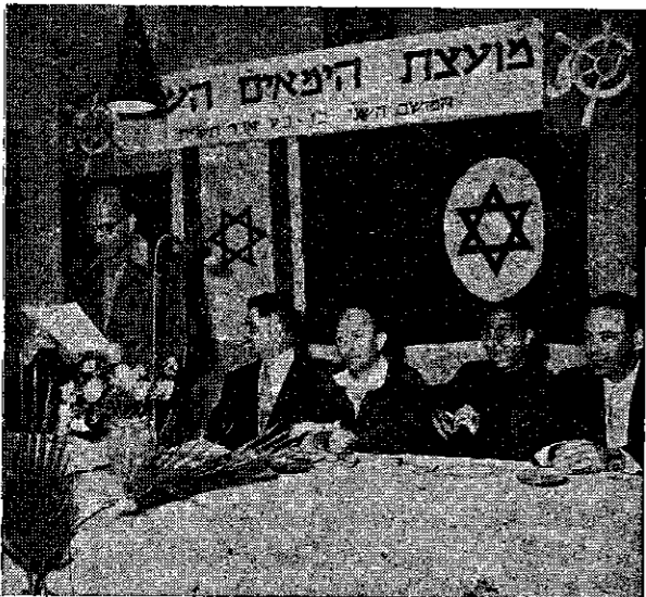
משרד התחבורה ער לבעיות היומיומיות והמיוחדות של ציבור הימאים...

כדי לאפשר לבעלי השכלה נמוכה להתקדם ולעלות לדרגת קצין הננו מקיימים קורס מיוחד ל-16 מלחים ותיקים בדרגת חובל שלישי. קורס זה יימשך כ-6 חדשים במקום 3 חדשים כרגיל ומשרד התחבורה משתתף בהחזקת אנשים אלה בומן הלימודים בסך 9 אלפים ל"י בקירוב. קורס דומה ייפתח בקרוב לעובדי מנוע ובו 15 איש. משרד התחבורה ישתתף