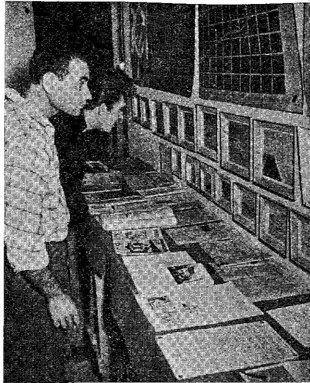
ימאים מבקרים בתערוכת-האיגוד במועדון הימאים ברחוב מטוה

המרכז לתרבות וחינוך של ההסתדרות מספק אמנים, משיא עצה, מנחה קצת, אך אין זה מספיק. אני יודע, שיש נסיון להפעלת גורמים צעירים שונים, שיהיו ידידי המפעל הזה. איני יודע באיזו מידה הצלחתם. נדמה לי, שהאנשים שיעסקו בזה - הסופר ורכו התרבות וכו' - צריכים להגיש תכנית