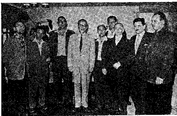
מוכירות האיגוד עם אורחי I.T.F.