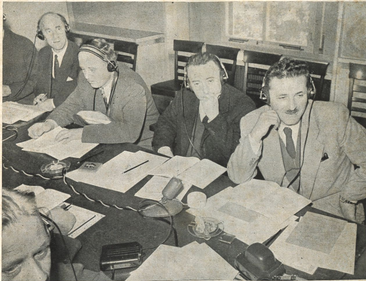
מזכיר איגוד הימאים בין צירי ועידת העבודה לענייני ספנות בז'נבה

ההסתדרות הכללית של העובדים העברים בארץ-ישראל