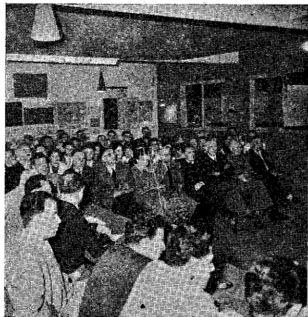
אורחי מועצת הימאים

בעקבות פניותינו אל משרד העבודה אורגנו קורסים מזורזים לעובדי מנוע, שמנים ומסיקים. הקורסים הראשונים התקיימו תוך קשיים רבים והמחזוריים הראשונים התקיימו ב-5—6 משתתפים, אולם במשך הזמן נערכו הקורסים מדי שבועיים בהשתתפות 15 איש ומעלה. הודות לקורסים ובעקבות הדרישות של משרד התחבורה מגיע מספר הנבחנים לתעודות סמיכות למכונה ל-80% בערך.