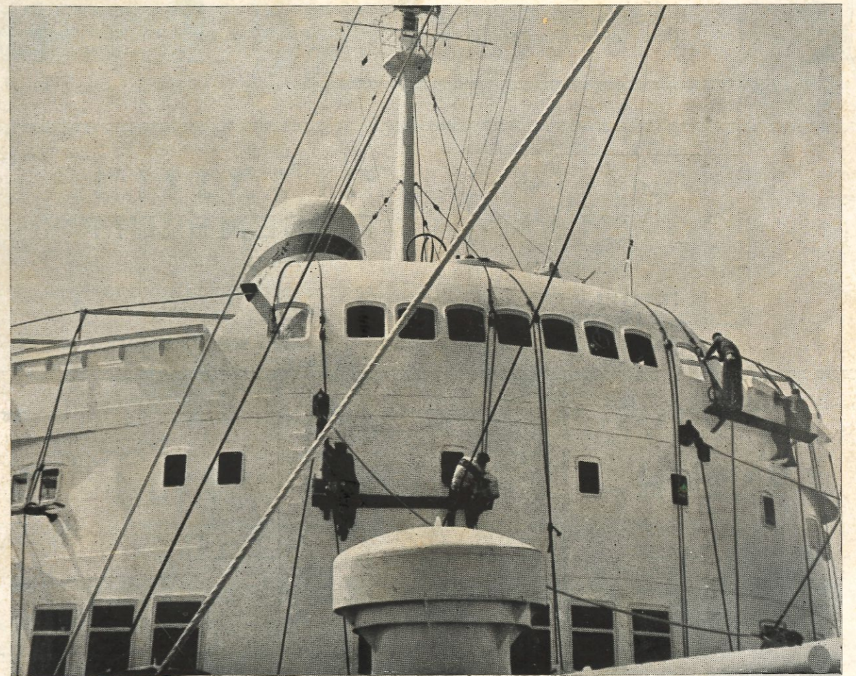
א/ק ציון לפני הגיעה לנמל הבית

The General Federation of Jewish Labour in Israel